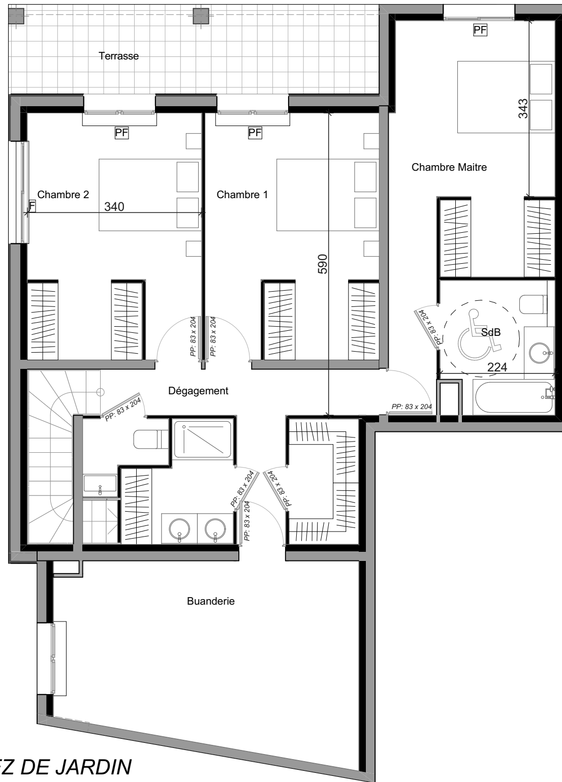
REZ DE JARDIN