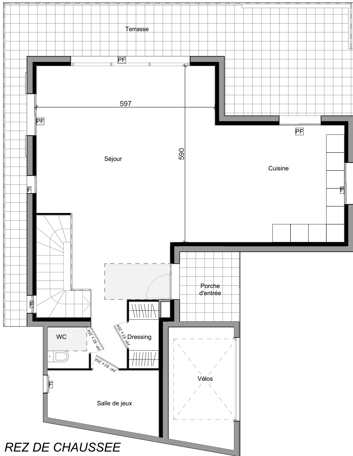
REZ DE CHAUSSEE